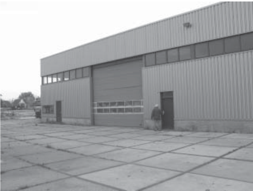
De loods aan de Houtmolen in Makkum, waar de TX 33 z'n laatste fase van de restauratie is ingegaan