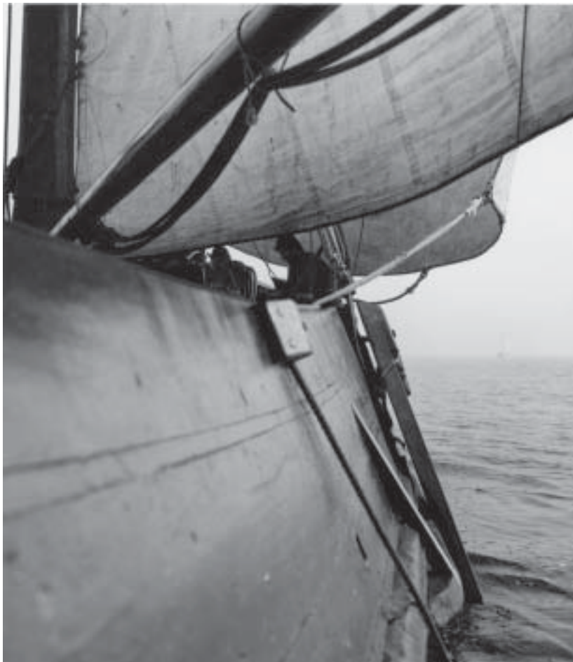
Foto van de TX 33, gemaakt door Gait Berk bij een artikel over de blazer in Spiegel der Zeilvaart, kort nadat het schip door Piet Dekker was gerestaureerd. (Juli 1977)